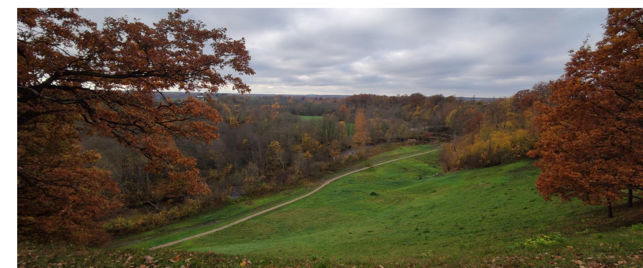
Atsiverianti panorama nuo Gondingos piliakalnio.

XX a. pr. seniūnijos gyvenvietėse pagausėjo vienkiemių, ypač šalia miškingų bei sausesnių, derlingesnių teritorijų. Atsigauna krašto ekonomika – tai rodo net 4 vandens malūnai, bei vienkiemių pagausėjimas.