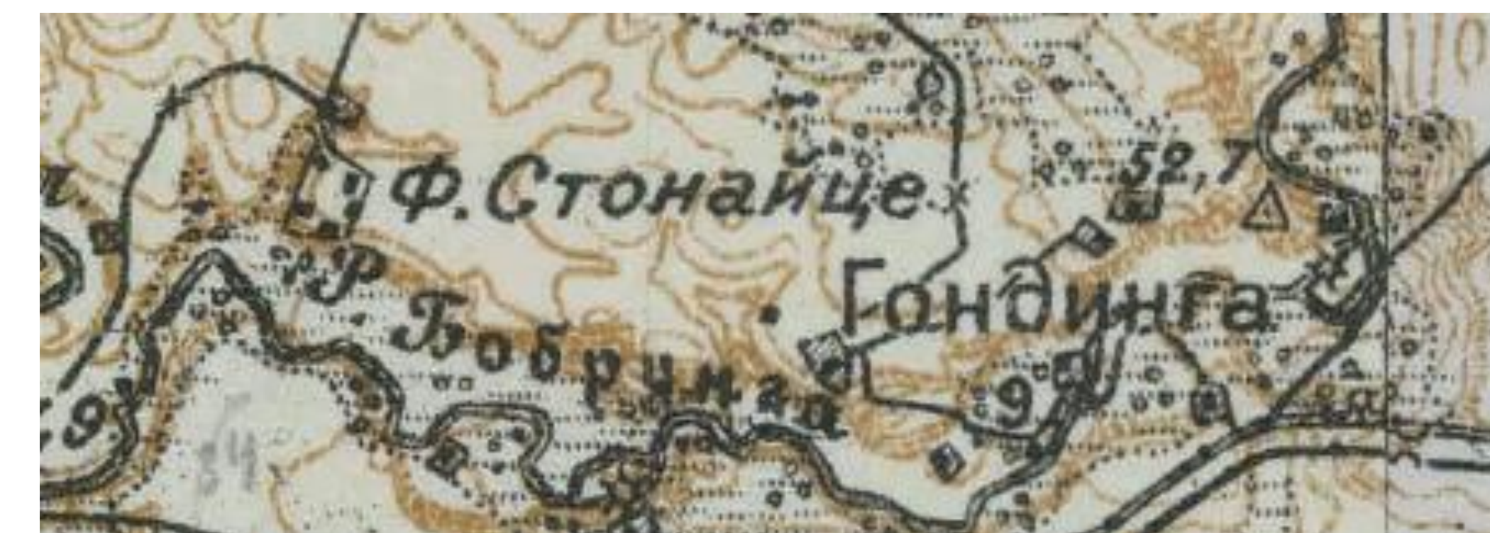
Stonaičių ir Gondingos gyvenviečių fragmentas 1913 m. žemėlapyje.